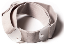
Universalgürtel HiMiV. 29.99.99.0002

REF: 3010 Hersteller Coloplast PZN: 9543825