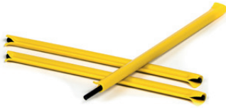
Beutelklammer HiMiV. 29.99.99.0002